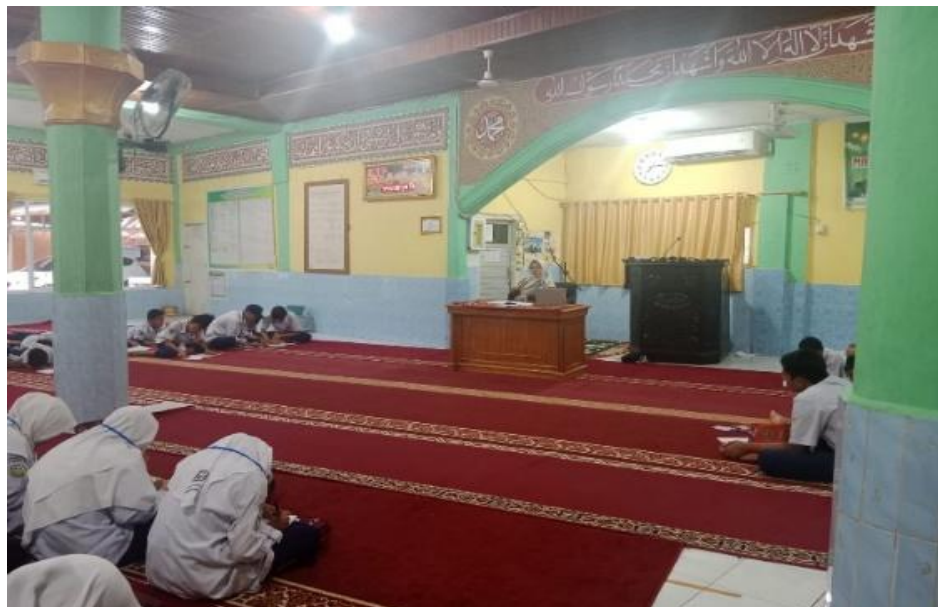
Gambar 3. Sesi Diskusi dan Tanya Jawab