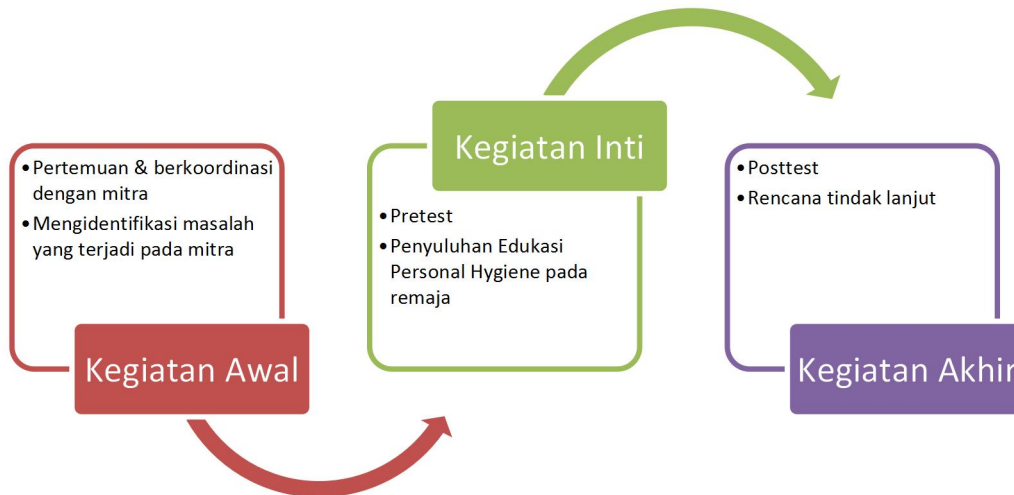
Bagan 1. Kerangka Kerja Kegiatan Edukasi Personal Hygiene pada Remaja Masjid Mutathahirin Lubuk Lintah Kuranji Padang