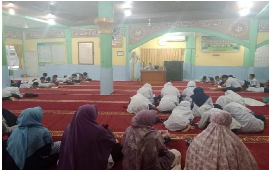
Gambar 2. Sesi Pemberian Materi Edukasi Personal Hygiene